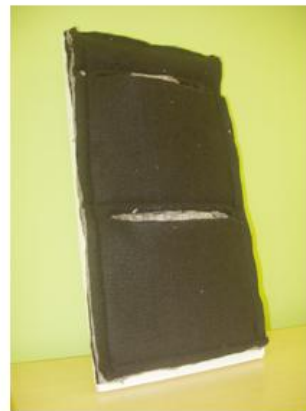
Фрагмент стены из растений, крепеж